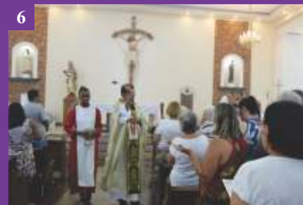
6 Batismo do Senhor (12/01/2020)