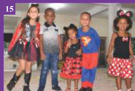
15 Grito Pré-Carnaval do ECC (15/02/2020)

Pesquise: http://www.nsmaedadivinaprovidencia.com.br/ clique no (flickr) e veja mais fotos!