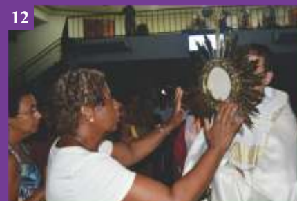
12 Missa pela Vitória (01/02/2020)