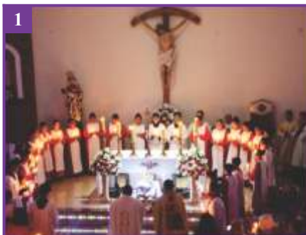
1 Missa da noite de Natal do Nosso Senhor Jesus Cristo (25/12/2019)