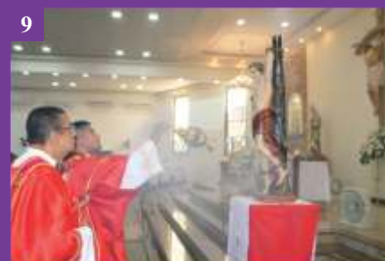
9 Solenidade de São Sebastião (20/01/2020)