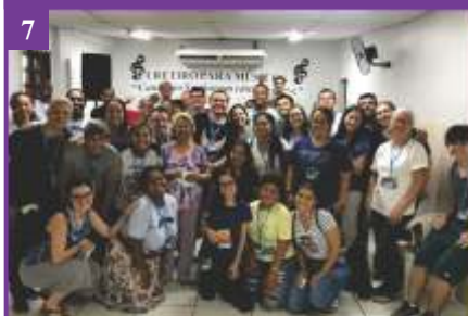
7 1º Retiro para Músicos (12/01/2020)