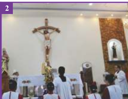
2 Festa da Sagrada Família - Jesus, Maria e José (29/12/2019)