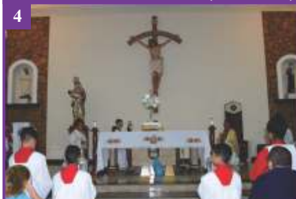
4 Missa pela Vitória (04/01/2020)