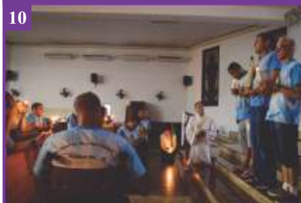
10 Terço Luminoso com as Famílias (31/01/2020)