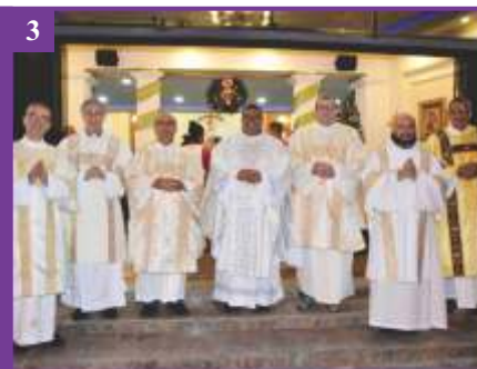
3 Solenidade da Santa Mãe de Deus, Maria (31/12/2019)