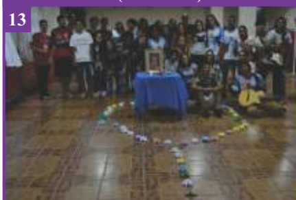
13 Encontrão do EAC (09/02/2020)