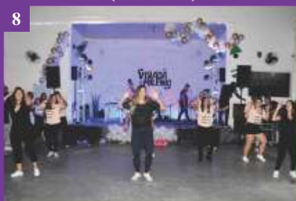
8 Virada do Milênio Festshow - EJC (18/01/2020)