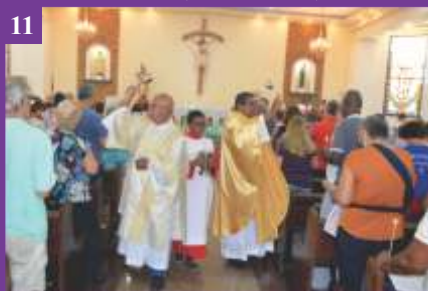
11 Festa da Apresentação do Senhor (02/02/2020)