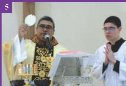
5 Solenidade da Epifania do Senhor (05/01/2020)