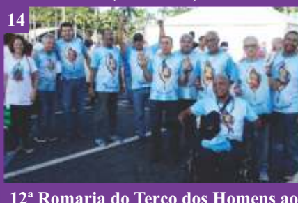
14 12ª Romaria do Terço dos Homens ao Santuário Nacional de Aparecida - SP (15/02/2020)